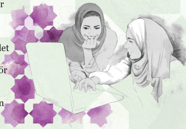
Illustration: Madelen Lindgren, MadeByLen

Som en konsekvens är det överfullt i fängelser och häkten, flera personer måste dela cell och dömda personer går fria i väntan på att det ska bli en fängelseplats ledig. Det är dyrt och tar lång tid att bygga nya fängelser.