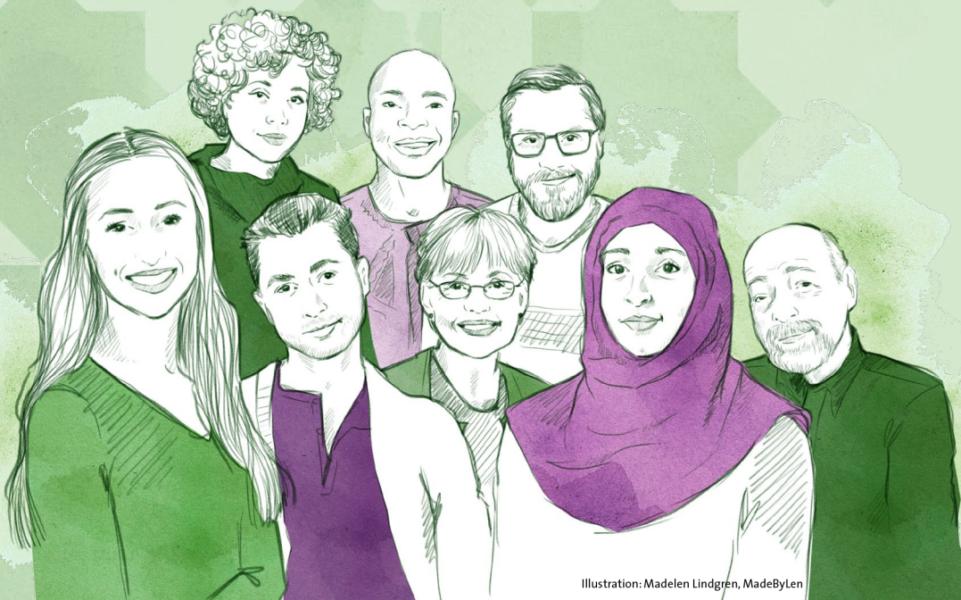
Illustration: Madelen Lindgren, MadeByLen

En studiecirkel om demokratin i Sverige, om hur man röstar och varför.