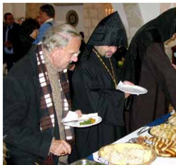
Alla lät sig väl smaka av den goda maten.