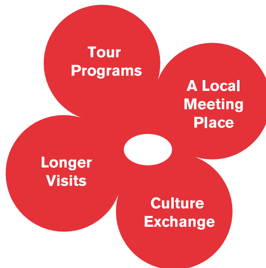
SCSC:s fyra kärnområden

Styrdokumentets visioner lyfter fram en rad möjligheter till utveckling av och fördjupning i Bildas folkbildningsuppdrag. Några centrala nyckelord i dokumentet är fältbaserade och gränsöverskridande studier , förstå sig själv lite bättre i en global värld, ”kulturell frihet” och andra aktuella frågor i det civila samhället. SCSC:s olika program ska bygga på ett medvetet perspektivval (solidarisk närvaro med de kristna kyrkorna), en medveten pedagogik (”deltagandets pedagogik”), en konstruktiv pluralitet och en engagerande progressivitet i val av möten