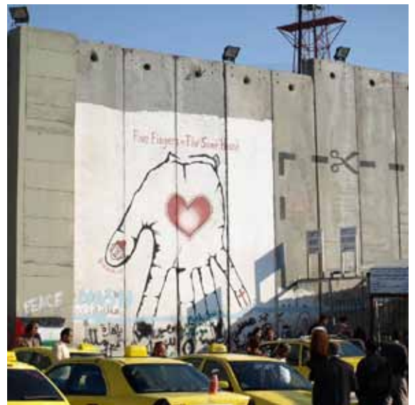
Ikke-våldsbudskap på muren kring Betlehem.