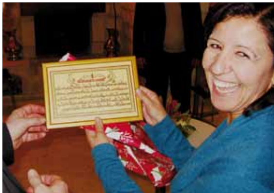
En tavla med Vår fader på Jesu eget språk var en av gåvorna till centret.