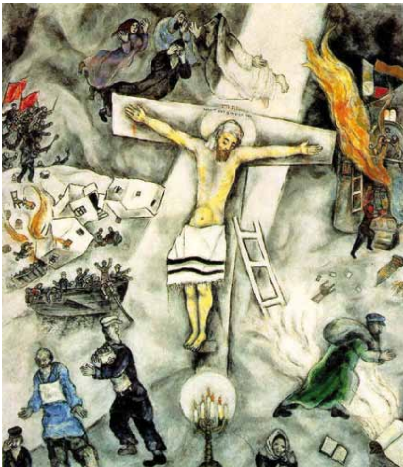
Marc Chagall förutsåg redan 1938 Shoah, den stora Förintelsen och framställde den i sitt verk Den vita korsfästelsen .

Huvudplatsen för den ortodoxa kristna kulturen, det ortodoxa kyrkorummet, kan aldrig förstås utan en tydlig koppling till det jordiska och till det himmelska Jerusalem. Det är för den ortodoxe kristne förlängningen av Templet i Jerusalem, som platsen för människans möte med levande Gud genom Hans Messias, Kristus. Det är platsen där det eviga möter det timliga. Platsen där det Allraheligaste sätter ett gudomligt avtryck i en värld av materiell